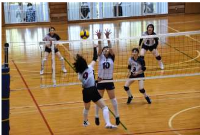
バレーボール競技