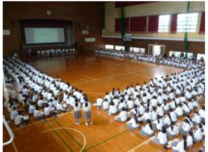
生徒総会の様子（体育館）