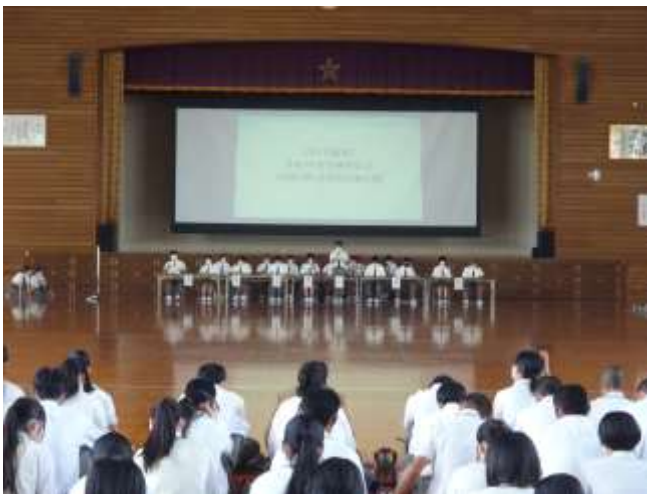
生徒会による各種報告と審議（体育館）

5月25日（木）、4年ぶりに全学年が体育館へ集合して令和5年度生徒総会を実施しました。生徒総会では各種専門委員会年間目標と活動計画の報告、令和4年度生徒会会計決算の報告、令和5年度の生徒会予算案の報告、クラスからの要望、長商生の課題を審議しました。クラスからの要望では「制服の移行期間をなくしてほしい」「教室内でセーターを着用して活動できるようにしてほしい」などの要望が上がりました。長商生の課題では積極的に「長商スマイル」「一流のあいさつ」に取り組むことで一致しました。また校則改定では「校内へのスマートフォンの持ち込みを許可してほしい」と言った意見が上がり、前年度の「マフラーの校則改定」を踏まえた審議が行われました。