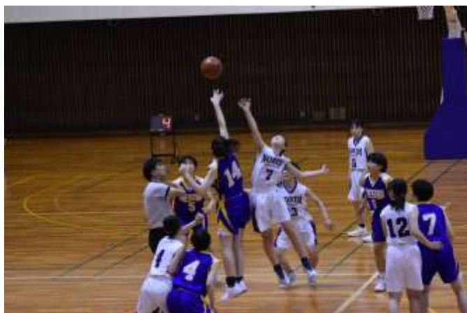
バスケットボール競技