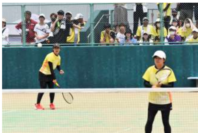
ソフトテニス競技