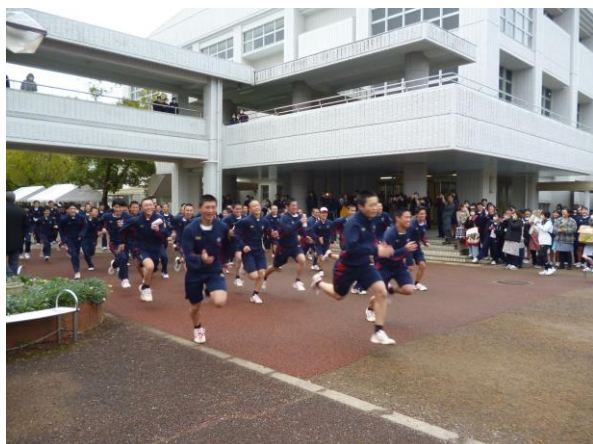
はりきってスタート

2月2日、これまでコロナ禍と当日の天候不順により開催できなかった強歩大会を4年ぶりに開催しました。そのため在校生にとって強歩大会は入学後初めての行事で、職員にとっても久しぶりの行事になりました。前年度が雨天中止になったため今回も当日の天候が危ぶまれましたが、幸い強歩大会当日の天候はくもり、午後はときどき晴れ間も見えました。コースの距離は約20kmでしたが、参加した多くの生徒が完走しました。また、強歩大会に併せてPTA有志の方々による豚汁の炊き出しも行われ、強歩大会でゴールした生徒たちに暖かくて美味しい豚汁が振舞われました。強歩大会の結果は、男子の部と女子の部で1年5組（スポーツビジネスコース）が1位を獲得しました。大会中は大きなトラブルやケガもなく、無事に終わりました。