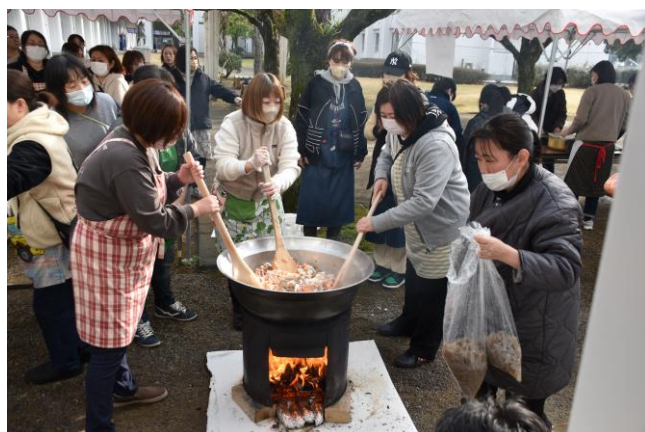
PTA有志の方による豚汁炊き出し