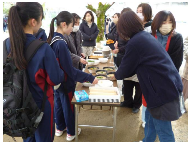
美味しい豚汁をいただきました