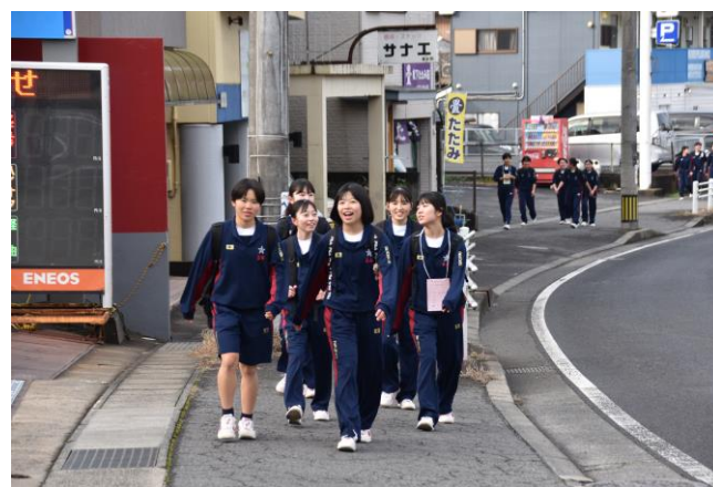
みんなで完走を目指しました